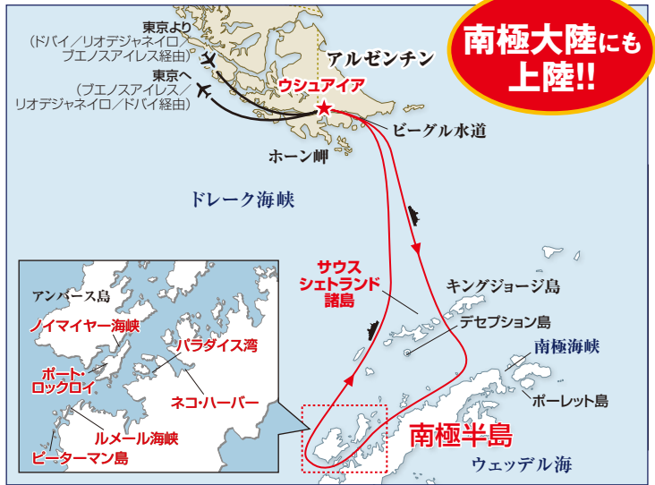
※地図はイメージです。